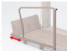
車椅子落下防止ガード