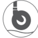
クッション キャスト