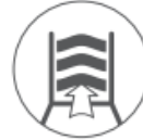
テンション 調整式シート