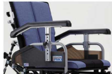
高さ調整式アームサポート