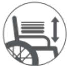
高さ調整式 アームサポート