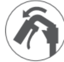
背折れ ジョイント