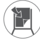
ワンタッチ ソフトシート