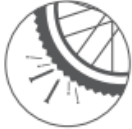
ハイポリマー タイヤ